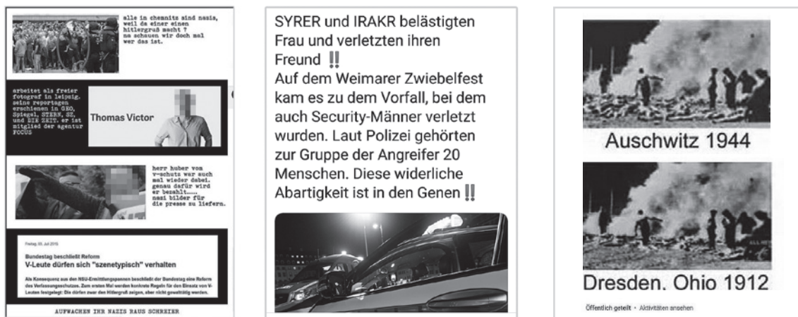
Figure 3: Memes that try to be convincing often use black-and-white images. When “alternative facts” are presented, they abandon design schemes from traditional journalism, suggesting “non-mainstream” sources instead. In other instances, design schemes from popular media outlets are imitated in order to emphasise the legitimacy of a claim.

freedom of speech with laws protecting individual rights and collective interests. These prohibit the coercion or denunciation of a person, depictions of extreme violence, and issuing any public call to commit criminal acts. The most significant difference between Swiss and German laws is the German prohibition of symbols of unconstitutional organisations (§86), including the National Socialist Party and its successor organisations. Using the swastika or Nazi propaganda imagery is thus explicitly forbidden under German law. More than a third of the memes reported feature forbidden symbols and/or Nazi propaganda imagery.