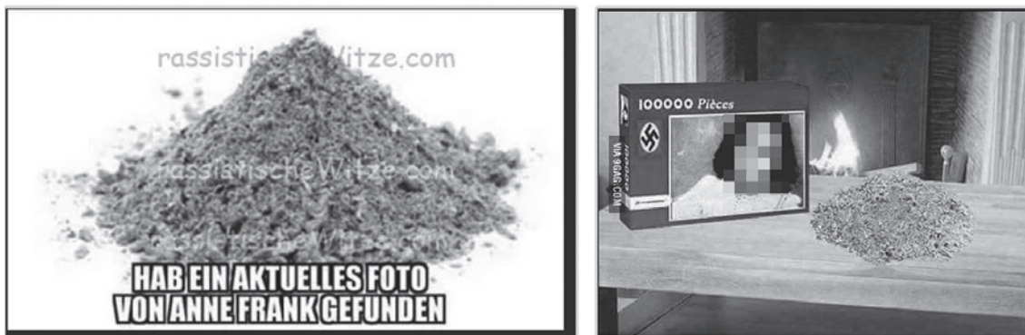
Figure 4: Memes building on the same idea can vary in the quality and intensity of their affect. Rhetorical design analysis allows us to identify the affect techniques that cause these differences.