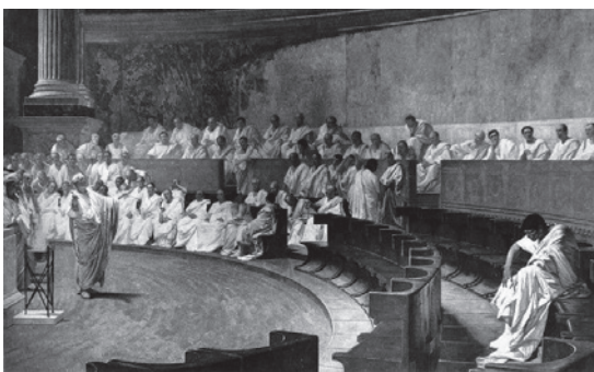
Figure 1: Cicero at his first speech against Catilina. Fresco of Cesare Maccari, 1888.

Racist speech in the Internet, structural racism in recruitment procedures, and racist stereotypes in advertising: racism occurs on many levels and is constantly being reproduced and updated through cultural practices. Speaking, acting and showing are closely intertwined in everyday life. Images, however, acquire a role that is different from that of texts and actions because they can exert a swift, powerfully emotional impact where texts need time to influence the feelings of a reader. Their immediacy also means that images often create an implicit imperative to act. This phenomenon can be subjected to scholarly investigation by examining visual rhetoric. Our starting point here is the observation that images can almost always be used with intentional agency. This is not a new phenomenon. Even in early history, pictorial narratives were used to create religious solidarity; portraits were used by the Greeks to serve men in powerful positions; and advertising signs were employed to lure Romans into visiting the local baths. And this phenomenon has from the very start been linked with rhetoric.